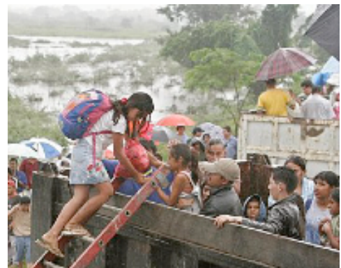
Evacuación de inundaciones