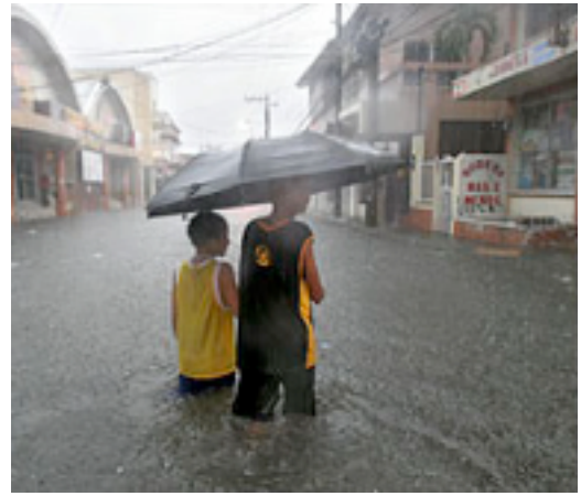
Inundaciones provocadas por el huracán Henriette