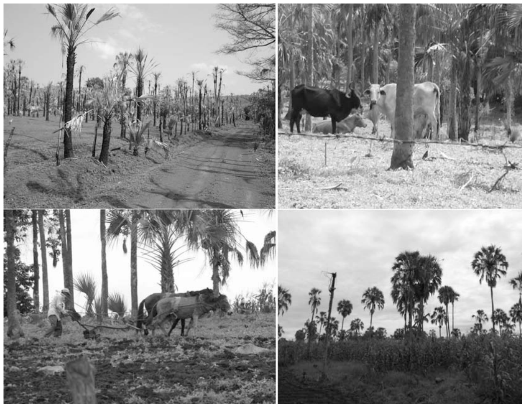
FIGURA 3. FACTORES DIRECTOS E INDIRECTOS DEL CAMBIO EN LA POBLACIÓN DE PALMA REAL

la compra de productos agro-químicos, rebasa sus ingresos. Por ende, la emigración es un fenómeno frecuente. En el área de estudio la percepción de la gente se refleja en afirmaciones como la siguiente: “Casi todos los pueblos tienen la mitad de la población en Estados Unidos y mandan su dinero al pueblo para construir sus casas y mantener a los padres” (Sr. Ramón, 42 años)