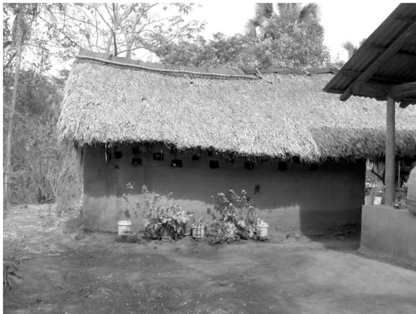
FIGURA 4. UNO DE LOS SERVICIOS DE APROVISIONAMIENTO PROVEÍDO POR LA PALMA

Escenario 2. Beneficios mutuos. Otra posible alternativa sería tratar de implementar nuevas técnicas de “transformación” de la hoja para darle un valor agregado. Es decir, impartir talleres sobre las técnicas de blanqueado y la manufactura de todo tipo de artesanías. Esta sería una alternativa viable gracias a varios factores: el valor del producto au-