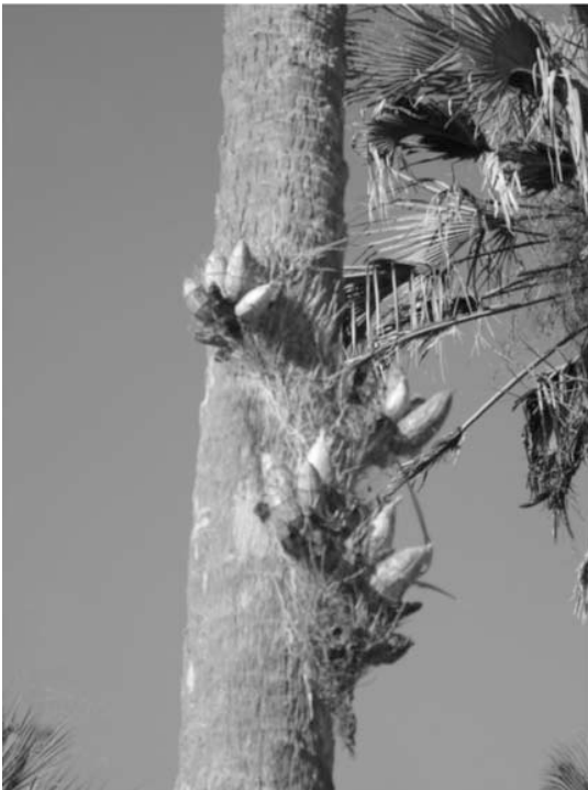
FIGURA 2. EL SERVICIO DE APOYO PROVEÍDO POR LA PALMA CONSISTE EN SER SUSTRATO ÚNICO DE ORQUÍDEAS MICROENDÉMICAS