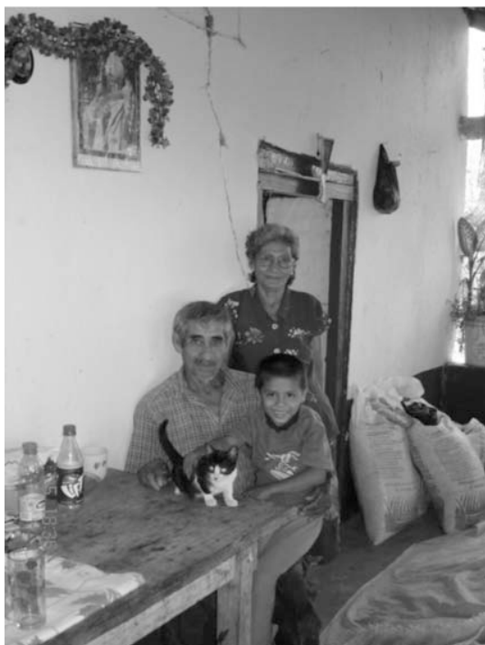
FIGURA 5. HABITANTES DE LA LOCALIDAD DE LOS COPALES EN EL MUNICIPIO DE LA HUACANA, MICHOACÁN

tes, ya que el poder adquisitivo de la gente aumentaría y la población de palma se vería fortalecida.